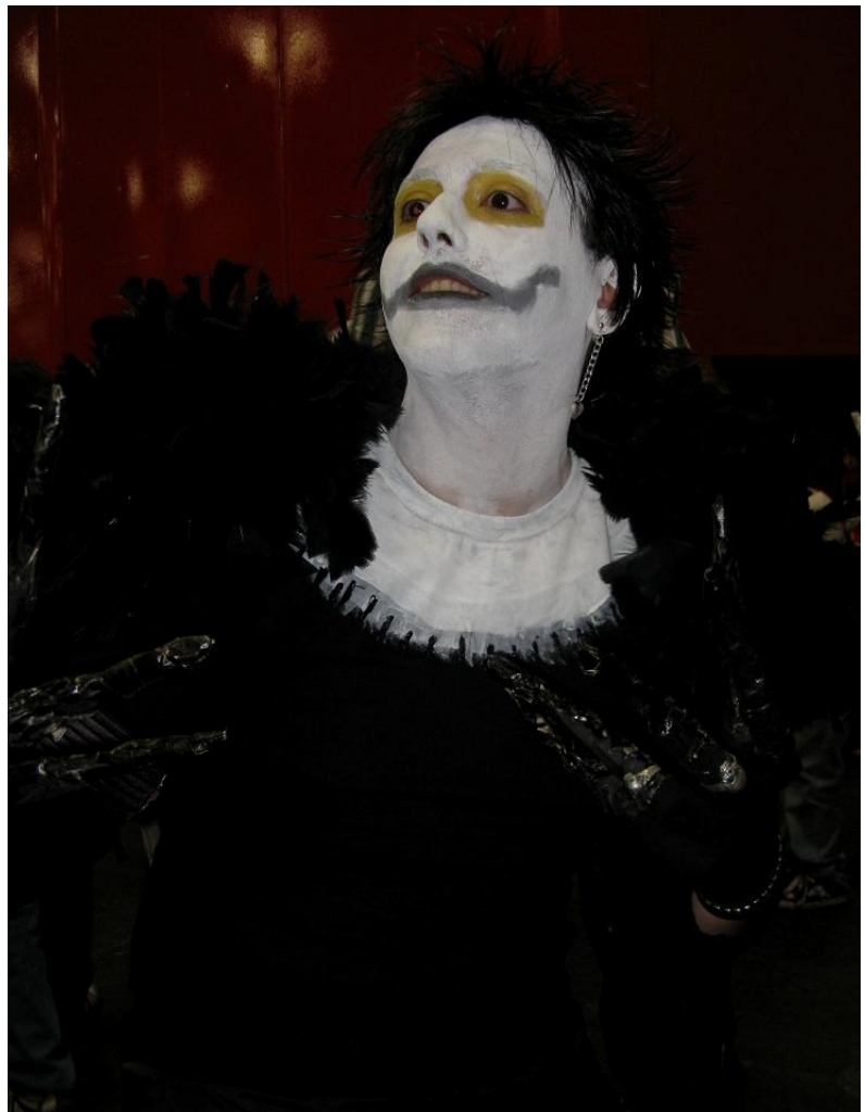
Il genio che ho adorato di più di tutti è stato Ryuuk....sembra Robert Smith dei The Cure ^__^